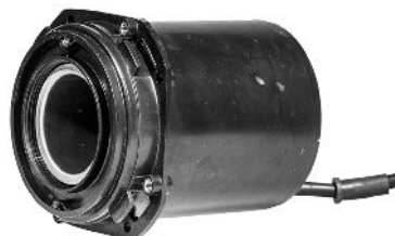
Pumpemotor / Pumpmotor