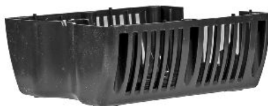
Nederste filterkammer / Undre filterkåpa