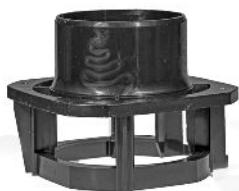
Rotorkammer / Rotorlock Art.nr. 30779