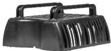
Øverste filterkammer / Övre filterkåpa